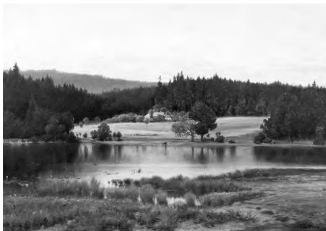
Antonín Chittussi: Lovětínský rybník

Krajinomalba patřila a patří celosvětově k divácky a ná- vštěvnicky nejpřitažlivějším výtvarným okruhům. Krajiny coby všeobecně srozumitelné a emočně sdílné obrazy evo- kují jednoznačně pozitivní pocity, jako jsou domov, rodina, svoboda, vlast, harmonie. Cílem výstavy bylo posílit vědo- mí národní důležitosti, ukázat rozmanitost koutů celé čes- ké země a rozličné typy uměleckého pojetí krajinomalby v běhu několika po sobě jdoucích generací. Díla však ne- představila jen krásu české země. Na výstavě pro ucelený dojem z díla českých krajinářů bylo možno nalézt mezi vy- stavenými obrazy ozvuky z cest a dále zachycených čes- kýma očima – byly zde vystaveny i nestárnoucí scénérie z Francie, Itálie, pobřeží Jadranu a dokonce i z exotických krajín, jako jsou například Čína nebo Cejlon, dnešní Srí Lanka.