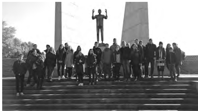
Konzentrationslager Mauthausen (die „Todesstiege“)