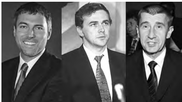
Nejbohatšími podnikateli jsou Petr Kellner, Pavel Tykač a Andrej Babiš

Pořadí nejbohatších Čechů podle týdeníku Euro se na prvních třech místech nezměnilo. Na čele zůstává Petr Kellner, navzdory snížení majetku o zhruba šest procent na 123-150 miliard korun. Na druhém místě je majitel skupiny Agrofert a ministr financí Andrej Babiš s 95-110 miliardami korun, třetí je Pavel Tykač s majetkem 30,6-35,8 miliardy korun. Informuje o tom týdeník Euro , který kompletní žebříček stovky nejbohatších Čechů a Slováků zveřejnil 29. září. Majetek stovky nejbohatších Čechů a Slováků dosáhl 918 miliard korun, což proti předchozímu roku představuje navýšení o téměř 66 miliard korun, tedy o zhruba osm procent. V žebříčku se proti minulému roku objevilo jedenáct nových miliardářů.