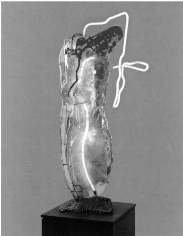
Zdeněk Pešánek: Mužské a ženské torzo , model světelné fontány pro světovou výstavu v Paříži, 1936, neon, sklo, plexisklo, umělý kámen, dřevo, dráty

Zdeněk Pešánek byl český sochař, malíř a architekt, průkopník v oblasti multimediálního kinetického umění. Studoval na sochařské a kamenické škole v Hořicích a na Akademii výtvarných umění v Praze v ateliéru Jana Štursy. Vzdělání si ještě doplnil soukromým studiem architektury u Jana Kotěry. Jako student projevovat smysl pro výrazné tvary, postupně se však vzdálil klasickému pojetí soch a tradiční sochařské materiály vyměnil za elektrické světlo, pohyb, zvuk a barvu. Od roku 1924 byl členem Devětsilu. Je považován za nedocenenou osobnost české i světové meziválečné avantgardy, za tvůrce, který se s pozoruhodnou soustavností věnoval kinetickému multimediálnímu umění a realizoval ve své době nejvíce prací tohoto typu. Jako první na světě vytvořil kinetické plastiky umístěné ve veřejném prostoru (Edisonova transformační stanice). Svým osobitým přístupem a používáním neonu jako uměleckého výrazového prostředku předběhl vývoj výtvarného umění nejméně o třicet let, proto mu patří významné místo ve světových dějinách umění 20. století.