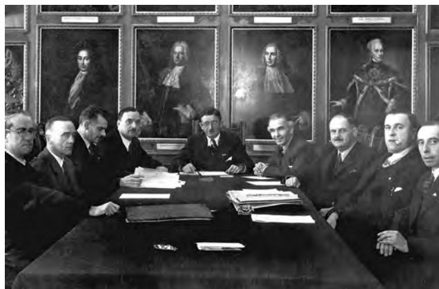
První zasedání Národní rady

20. 12. První spolková vláda ve složení členů tří v parlamentě zastupujících stran ÖVP (Rakouská lidová strana), SPÖ (Sociálně demokratická strana Rakouska) a KPÖ (Komunistická strana Rakouska) pod vedením kancléře Leopolda Figla (ÖVP) se ujímá vlády. Ten samý den zvolilo Spolkové shromáždění Karla Rennera (SPÖ) prvním prezidentem druhé Rakouské republiky. Právník Dr. Karl Renner (14. 12. 1870, Dolní Dunajovice / Unter-Tanowitz – 31. 12. 1950, Vídeň) byl rakouský sociolog a marxisticky orientovaný politik Sociálně demokratické strany Rakouska. V letech 1918-1920 byl prvním kancléřem Rakouské republiky. Dipl.-Ing. Dr. h. c. Leopold Figl (2. 10. 1902, Michelhausen, Rakousko – 9. 5. 1965, Vídeň) byl rakouský křesťanskodemokratický politik, představitel Rakouské lidové strany. Byl kancléřem Rakouska v letech 1945-1953. V letech 1953-1959 byl ministrem zahraničních věcí ve vládě Julia Raaba.