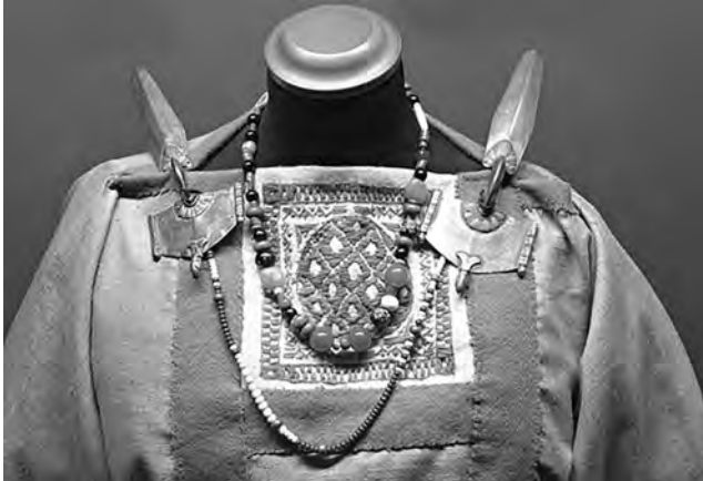
Rekonstrukce barbarské módy z doby stěhování národů

Datum vzniku rozsáhlého pohřebiště z doby stěhování národů odhadují odborníci na druhou a třetí třetinu 5. století našeho letopočtu. Získané poznatky jsou překvapivé – když se Římská říše postupně rozpadala pod náporem Hunů a Germánů, stalo se české území s Prahou místem, kde migranti našli na nějakou dobu své útočiště.