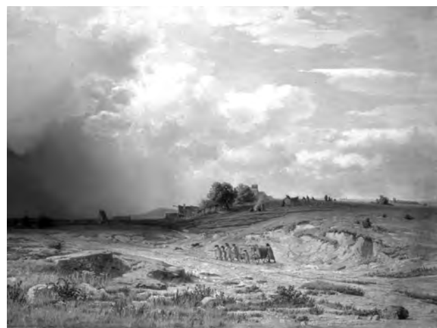
Adolf Kosárek: Podzimní krajina

Jedinečná expozice Má vlast představila návštěvníkům 450 obrazů a 150 kreseb zapůjčených ze sbírek Pražského hradu a předních uměleckých institucí, které mapují vývoj české krajinomalby v chronologické posloupnosti s důrazem na význačná období, krajinářské školy a nejvýraznější osobnosti. Mezi exponáty byly zastoupeny kresby Mikoláše Aleše, Josefa Lady, Antonína a Josefa Mánesových, Emila Filly, Václava Špály, Jana Zrzavého a mnoha dalších předních českých umělců. Některá vystavená díla navíc nebyla doposud veřejnosti nikdy prezentována.