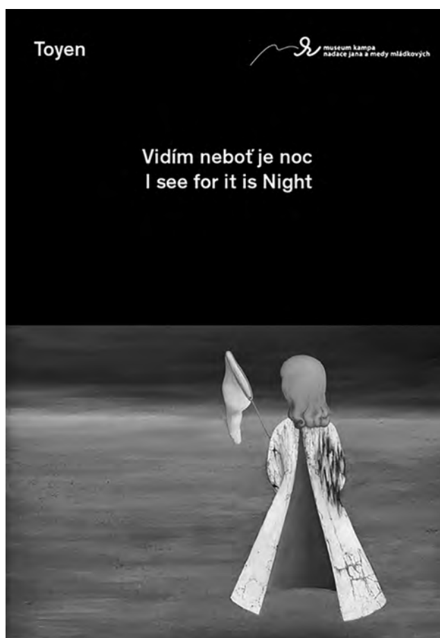
Pozvánka na výstavu Toyen Vidím neboť je noc

Museum Kampa na počest své zakladatelky Medy Mládkové a u příležitosti oslav jejích narozenin uspořádalo unikátní výstavu Toyen, česko-francouzské malířky Marie Čermínové, nazvanou Vidím neboť je noc . Expozice vedle nejznámějších děl představuje i řadu u nás dosud nevystavovaných obrazů z padesátých a šedesátých let minulého století.