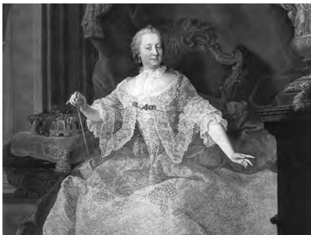
Marie Terezie, česká a uherská královna, rakouská vévodkyně

prvorozenosti, v mužské i ženské linii), měla legálně nástupnické právo, ale na západě i na severu se okamžitě přihlásili se svými fiktivními nároky na habsburské dědictví sousedé: kurfiřti saský a bavorský a pruský král Fridrich II. Právě ten byl nejvíc nebezpečný. A konflikt nakonec vypukl koncem roku 1740 a dnes je znám jako války o země Koruny české. Válka s Pruskem přinesla hospodářskou krizi pro obě strany, naděje na vrácení Slezska byly nulové. Když zemřel bavorský vévoda Karel Albrecht, vybojovala si Marie Terezie zvolení svého manžela Františka Štěpána Lotrinského římskoněmeckým císařem (1745).