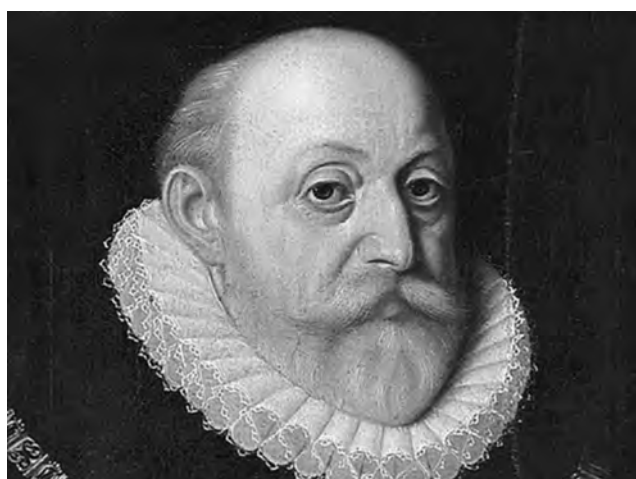
Vilém z Rožmberka, výřez z obrazu Charlese Luise Philippota

Po návratu z Itálie roku 1552 vstoupil do oficiální české politiky. V této době Vilém rozšířil rodový rožmberský znak s červenou pětilistou růží o stříbrné a červené pruhy se zlatým břevnem, které symbolizovaly údajné spříznění s italským rodem Orsini. V roce 1566 byl pověřen vedením českého vojska, jež mělo zasáhnout do protitureckých bojů v Uhrách. Roku 1570 dosáhl vrcholu své politické kariéry, kterého mohl šlechtic v Čechách dosáhnout. Vrcholu diplomatické kariéry dosáhl v letech 1572-1573, kdy byl Habsburky pověřen vést jednání o polský trůn, kde získal náklonnost polské šlechty a byl navržen na kandidáta na