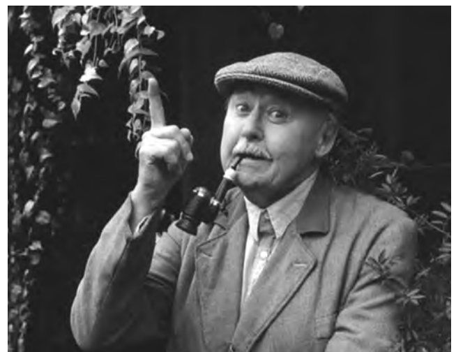
Lubomír Lipský v roli dědy Potůčka v seriálu Tři chlapi v chalupě

Po maturitě na reálném gymnáziu absolvoval Lubomír Lipský osm semestrů na Filozofické fakultě Univerzity Karlovy v Praze, obor divadelní věda a estetika. Vedle divadla se od dětství zajímal o hudbu, ještě na základní škole se naučil hrát na klavír, na střední škole přidal saxofon a začal hrát v jazzovém orchestru. Později získal praxi i v hraní na pozoun. Na konci protektorátu vytvořili mladí pelhřimovští ochotníci tajně kabaretní pásmo Rozbitá trilogie . S ním po osvobození hostovali v Praze, kde si jich všiml režisér Jan Škoda a nabídl jim založení divadla v Praze. Pětice pelhřimovských mladíků tak v létě 1945 v Umělecké besedě na Malé Straně založila Divadlo satiry a z Lubomíra Lipského se tak stal herecký profesionál. V Divadle satiry vydržel do roku 1949, kdy bylo divadlo z moci úřední zlikvidováno. V taneční skupině divadla se nicméně stačil seznámit