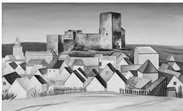
Jan Zrzavý: Lipnice