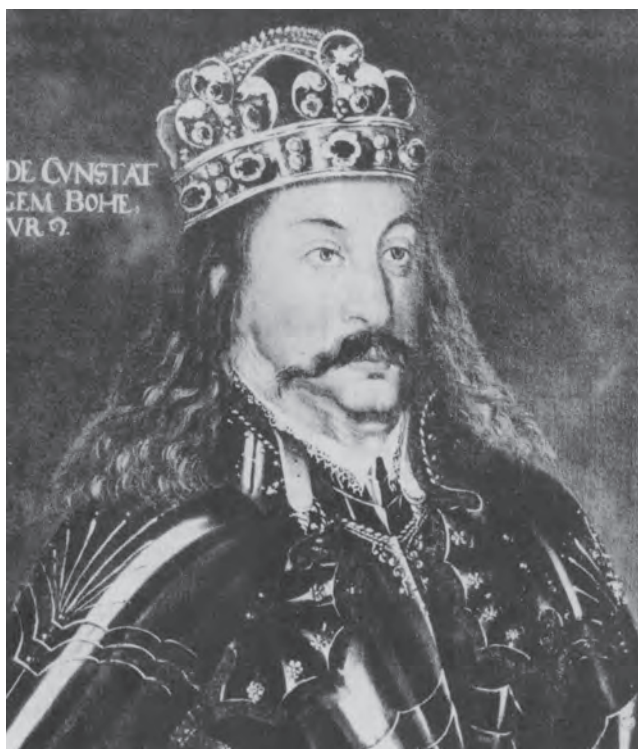
Český mistr: Jiří z Poděbrad, 16. století

byl od roku 1458 po zvolení českou šlechtou až do smrti roku 1471 českým králem. Stal se jediným českým panovníkem, který nepocházel z panovnické dynastie, ale z panského stavu domácí šlechty. Po něm vládli již pouze králové z cizích dynastií.