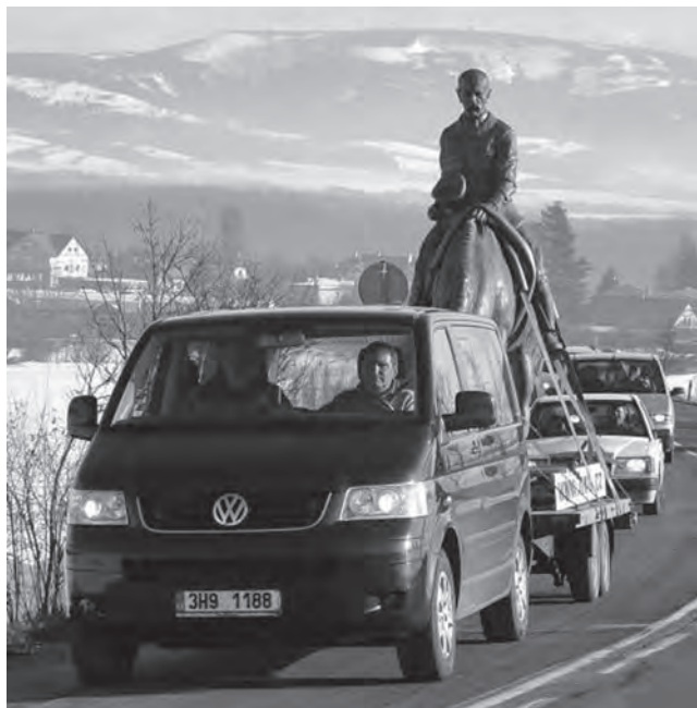
Socha TGM na cestě