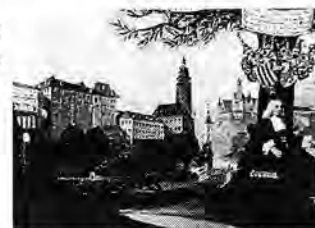
Dělení růží - Český Krumlov zámek

Podmínky soutěže : zúčastnit se mohou školáci či studenti do 27 let.