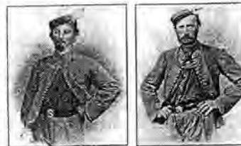
Jindřich Fügner, spoluzakladatel Sokola a jeho první starosta

na schůzi v pražské Panské ulici byla založena první sokolská jednota, historický Sokol Pražský. Národní listy to komentovaly slovy: "O účelu a prospěšnosti tělocvičné jednoty netřeba zde šířiti slov, toliko podotýkáme, že do tělocvičné jednoty vstoupiti může každý bez rozdílu