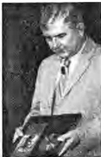
Miroslav Donutil převzal Zlatou desku

Deska obsahuje Donutilovo vyprávění z jeho dlouholetého brněnského působitě. (mk)