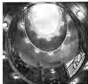
Ministerstvo obchodu a průmyslu, světlík ochozové haly. Fotografie z knihy

Všechny fotografované objekty jsou bez lidí a tím zřetelněji vynikají některé drobné půvaby a detaily, které v obvyklém denním provozu zaniknou, například v pasáži Lucerna nebo v objektu dvorany pošty v Jindřišské ulici. (mk)