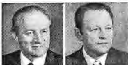
Milouš Jakeš a Jozef Lenárt

Bývalí komunističtí funkcionáři Milouš Jakeš a Jozef Lenárt se budou zodpovídat z toho, že v roce 1968 chtěli pomocí sovětských tanků nastolit v Československu loutkovou vládu. Městský státní zástupce v Praze je na návrh Úřadu dokumentace a vyšetřování zločinů komunistu obžaloval z vlastizrady. "Rok