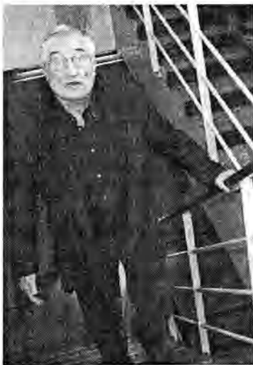
Herec a dramatik Pavel Landovský jako svědek u soudu