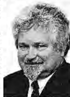
předseda Senátu Petr Pithart