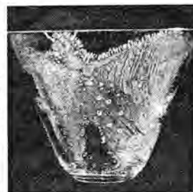
Stanislav Libenský: Adam a Eva, 1948

V pěti oddílech knihy je podán přehled škol, ateliérů, tvůrců a úspěchů. V šestém oddíle jsou pak