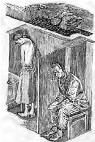
Ilustrace k Wolkerově baladě o narozeném dítěti, 1939, dřevoryt