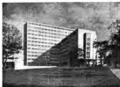
Všeobecný penzijní ústav v Praze na Žižkově (dnešní Dům odborových svazů).

Josef Havlíček (5. května 1899 až 30. prosince 1961) byl předním českým architektem konstruktivismu. Ke konstruktivistické architektuře se dopracoval na základě hlubokého vnitřního přesvědčení spolu s první skupinou průkopníků z Devětsílu .