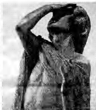
Fr. Bílek - Uvědoměný ze sousoší Budoucí dobyvatelé, dub (1931-32) detail