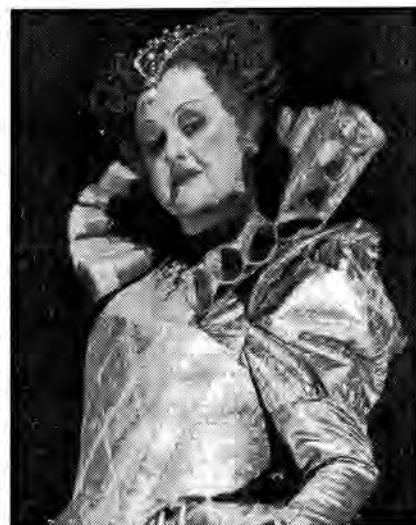
Edita Gruberová jako královna Elizabeth I ve Vídni

Na její nedávný výstup v Tokiu přišlo 19.000 lidí z široka a daleka.