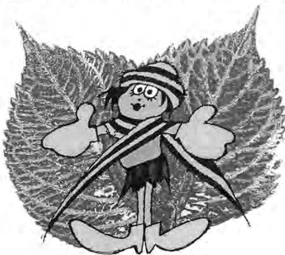
Rosnička na modrém listu

“A dobře činíš, neboť úspěch je předem zaručen,“ dal se