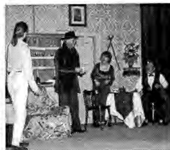
Divadelní představení Vlastenecké omladiny - Monsieur Amédée