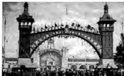
Vstupní brána výstaviště v roce 1891

Zajímavá výstava proběhla v Národním technickém muzeu v Praze na Letné. Technika v životě Pražanů byl její název a přinesla ukázky nových vynálezů, které na prahu minulého století výrazně ovlivňovaly a měnily chod i atmosféru města - v roce 1895 ozářilo Václavské náměstí světlo čtyřiceti obloukových lamp.