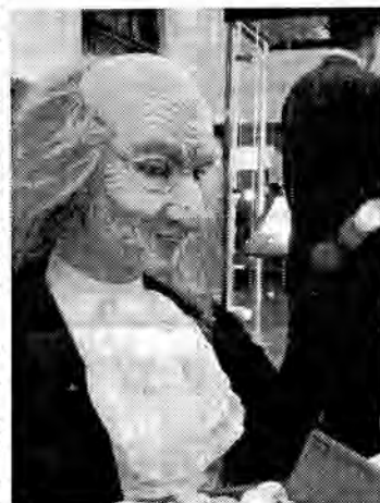
Výstavě vévodí figurína hraběho Harpagona v životní velikosti