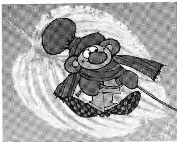
Rákosníček na bílém listu

Na Brčálník ještě nestačila padnout sněhová peřina a už ho přepadla pořádná zima. Rybník zamrzl od břehu ke břehu a led byl tlustý na tři Rákosníčkovy palce.