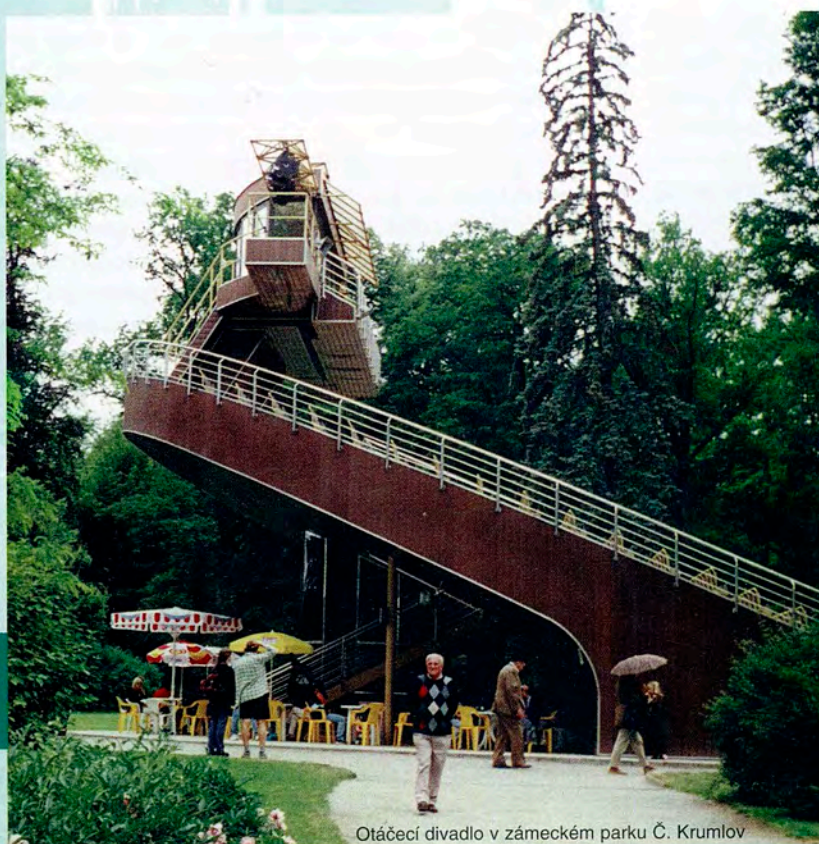
Otáčecí divadlo v zámeckém parku Č. Krumlov