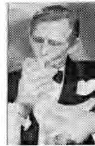
NEJLEPŠÍ MUŽSKÝ HERECKÝ VÝKON V HLAVNÍ ROLI Jiří Kodet (Pelišky)