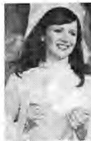
NEJLEPŠÍ ŽENSKÝ HERECKÝ VÝKON VE VEDLEJŠÍ ROLI Anna Geislerová (Návrat idiota)