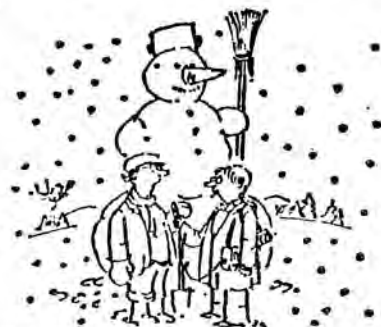
Vždycky jsem chtěl udělat něco velkého pro lidstvo...

Jak je vidět, bude Martin Turnovský v příští sezóně víc než dosud jezdit po světě, ale jak píše, "důfám ale, že se i do té Vídne zas častěji dostanu a snad na nějaký ten klubovní podnik budu moci zajít!"